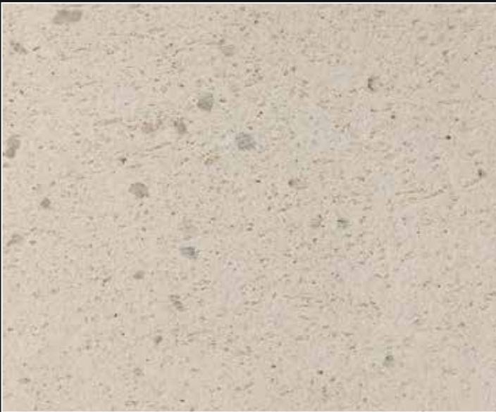
*Base DZ 09 + Chips Plata