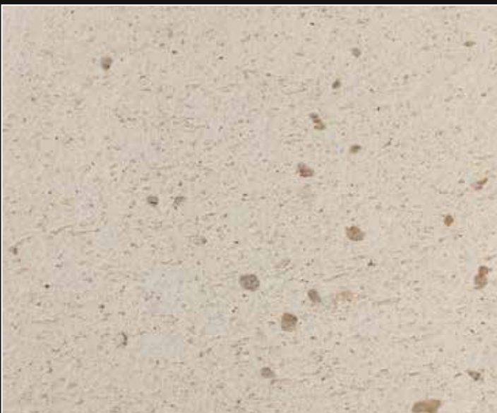
*Base DZ 09 + Chips Bronce

* Las referencias de Domiziano vienen con el color de chips de línea, mostrados en esta carta de color. En caso de requerir un tono diferente de chips, especificarlo como aquí se indica.