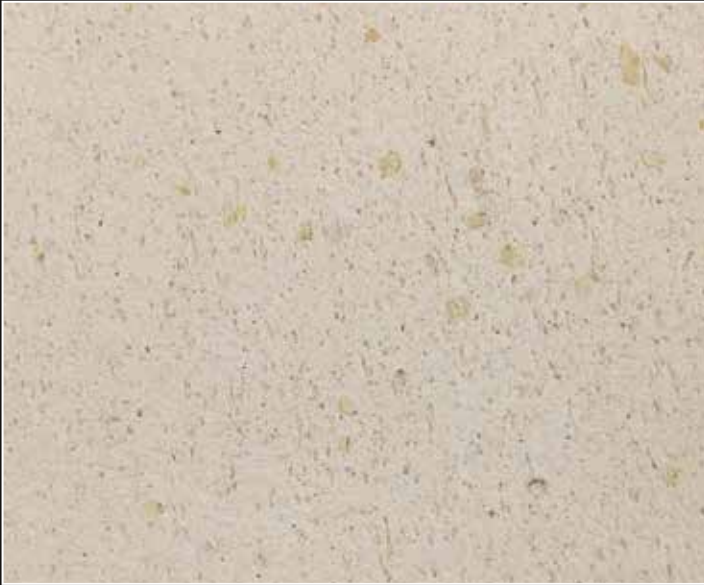
*DZ 09 con Chips Oro de línea