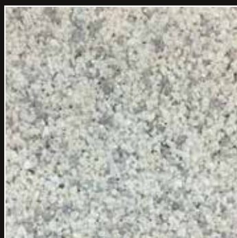
CD 23 Gris Perla