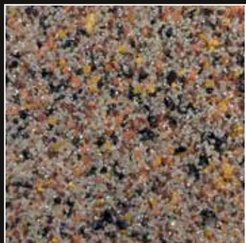
CD 10 Janitzio