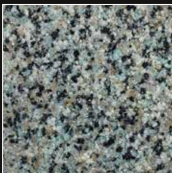
CD 07 Gris Badajos