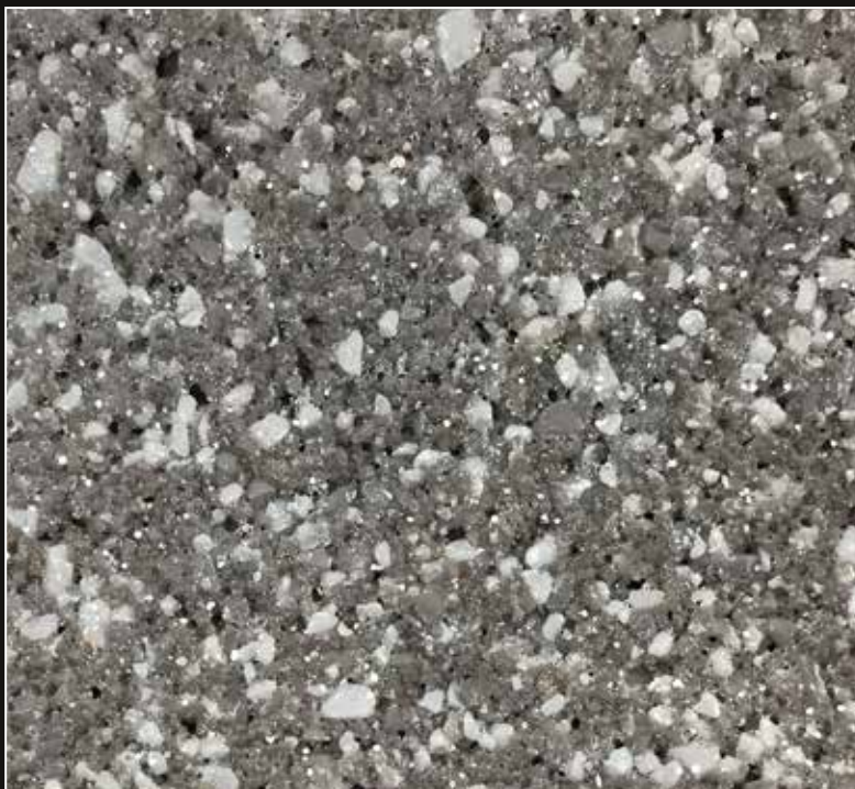
CD 12 Gris Acero