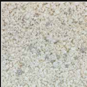
CD 17 Blanco Calido