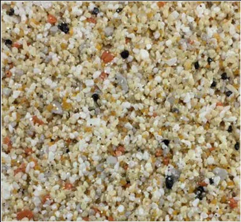
CD 13 Miel