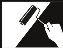
Fondear con SOTTOPAINT ó 30% de SUPERPAINT y 70% de SOTTOFONDO.