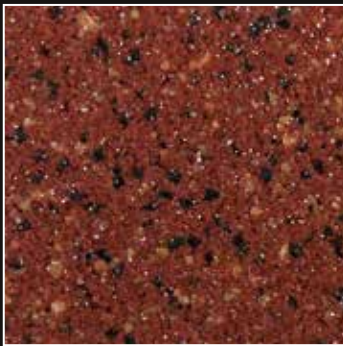
CD 19 Rojo Galicia