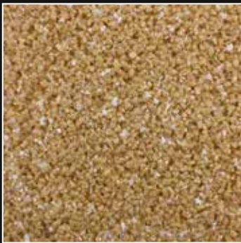
CD 32 Kalajari