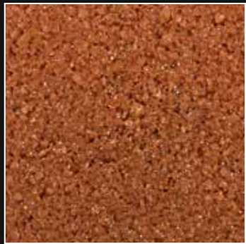
CD 31 Ladrillo