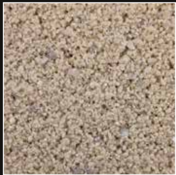
CD 22 Dunas