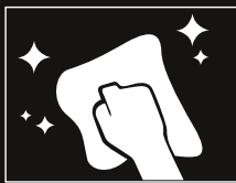
Limpiar y sellar la superficie con SOTTOFONDO 1000, 3xl ó 5xl.