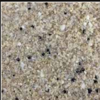
CD 11 Crema Marbella