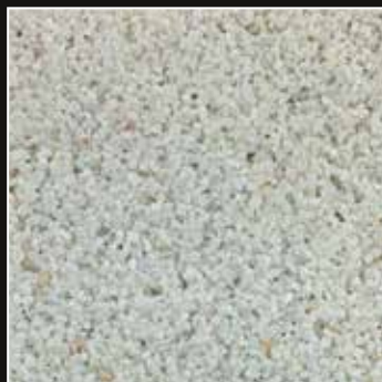
CD 30 Blanco Polar